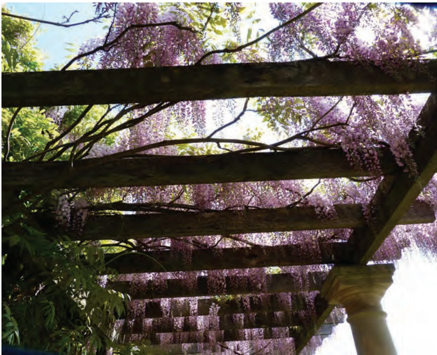
Wisteria sinensis – blåregn

Iögonfallande kiwisläkting som ger frodig grönska. Hanplantans blad färgas under sommaren i rosa och vitt. Kombineras med fördel med honkloner för läckra frukter.