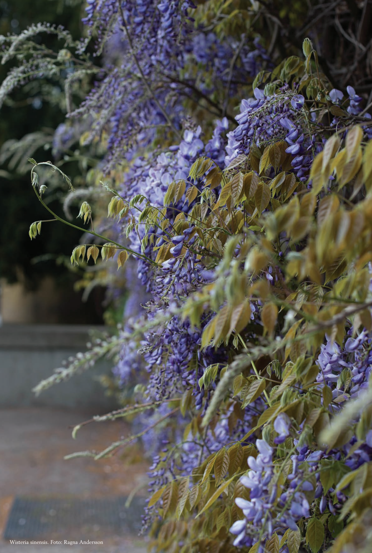
Wisteria sinensis .