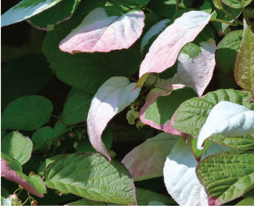
Actinidia kolomikta – kameleontbuske

Iögonfallande kiwisläkting som ger frodig grönska. Hanplantans blad färgas under sommaren i rosa och vitt. Kombineras med fördel med honkloner för läckra frukter.