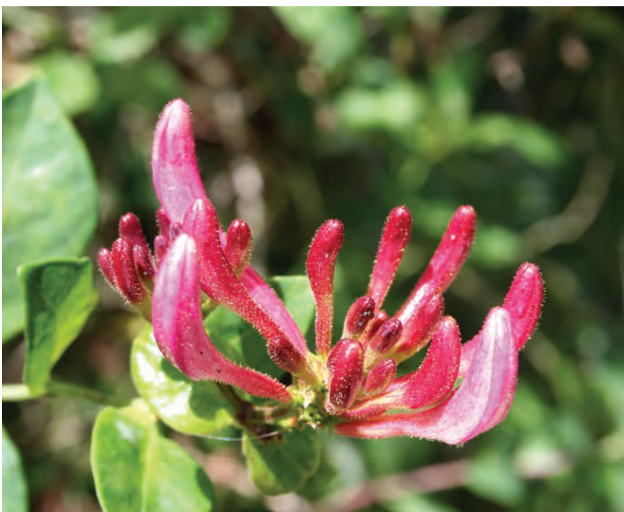
Lonicera periclymenum – skogskaprifol

Omtyckt lianlik klättrväxt med överdådig blomning i maj-juni. Lavendelblå, hängande klasar ackompanjeras av silvergrått ludet bladutspring.