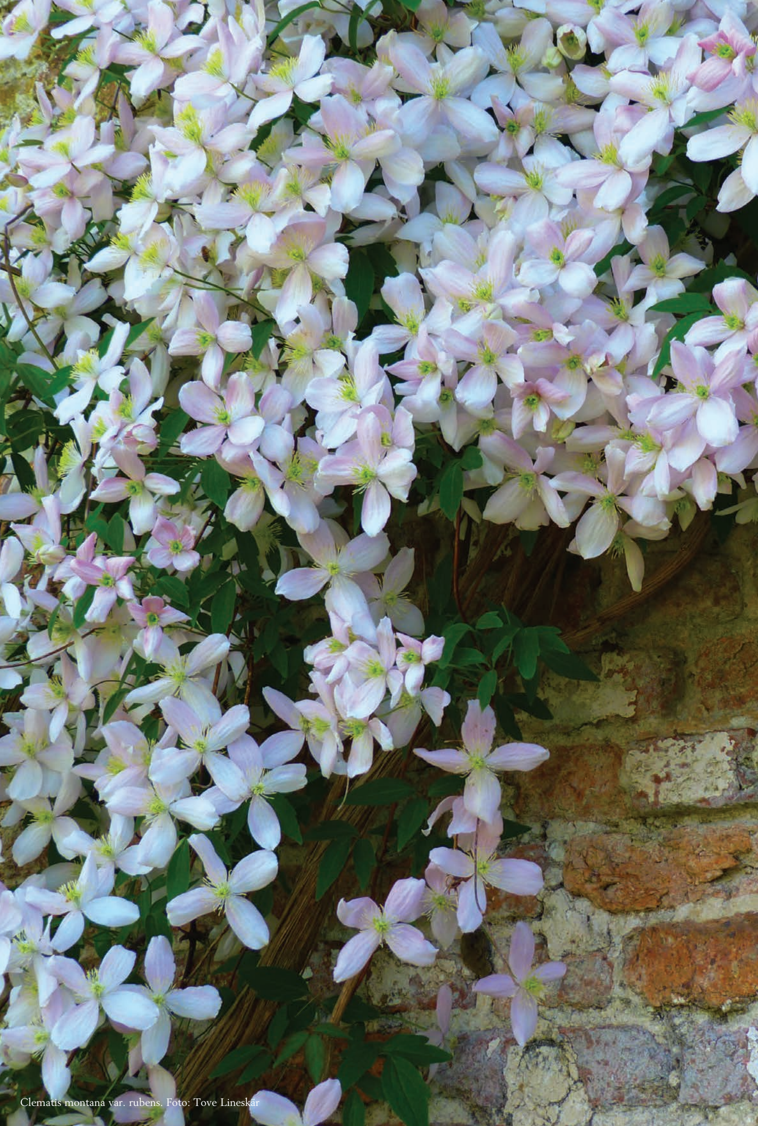
Clematis montana var. rubens .