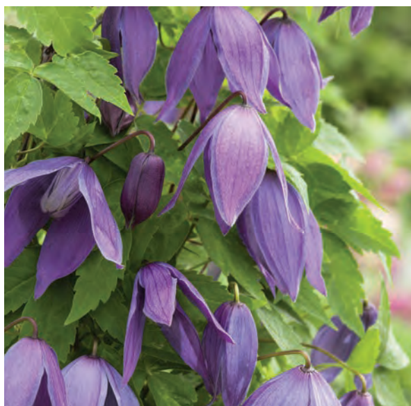
(ovan tv) Clematis 'Albina Plena' E

Vacker fylld klematis som blommar med stora nickande blommor i maj-okt.