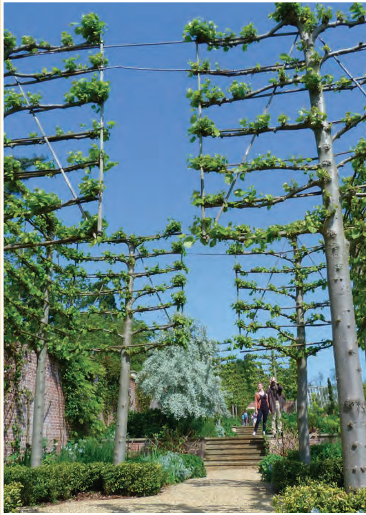
Formklippt, Häckar & Tillbehör